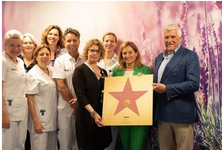
Gouden Ster Walk of Fame

Behalve deze drie sterren, is er nog meer toegekend: twee initiatieven kregen een eervolle vermelding en vijf projecten mogen ook aan de slag met het realiseren van hun aanvraag.