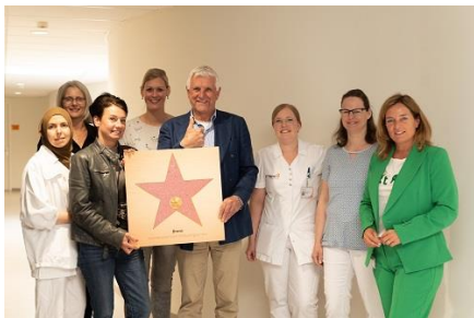
Bronzen ster Walk of Fame

Daarnaast zorgt het fietsen tijdens dialyse ook voor een korte onderbreking in een lange periode van zitten, voor de meeste patiënten is dat 3 x 4 uur per week. Yolanda en Irma liepen gelijk een rondje langs de patiënten die op dat moment aan dialyseren waren om hun het goede nieuws te vertellen. Het enthousiasme onder de patiënten was groot.