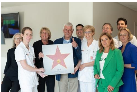
Zilveren ster Walk of Fame

"Hier zijn we echt blij mee", vertelt ze. "Het is zo frustrerend voor patiënten om iets duidelijk te willen maken en dat dat dan niet lukt. Met deze Ipad's kunnen we de patiënten ondersteunen en dat gaat zeker bijdragen aan het bevorderen van hun welzijn."