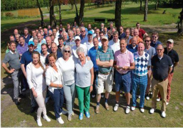
Bravis Golfdag 2017

Het jaarlijkse Bravis golfevenement biedt externe relaties van het ziekenhuis de gelegenheid om elkaar sportief te ontmoeten. Het sponsortoernooi is gespeeld op Golfclub Steenhoven in Postel. Het evenement wordt mede georganiseerd door hoofdsponsor Engie.